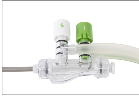
Sug och spol – spolhandtag