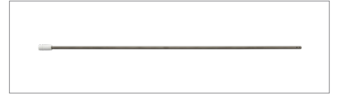
Sug- och spolmunstycken